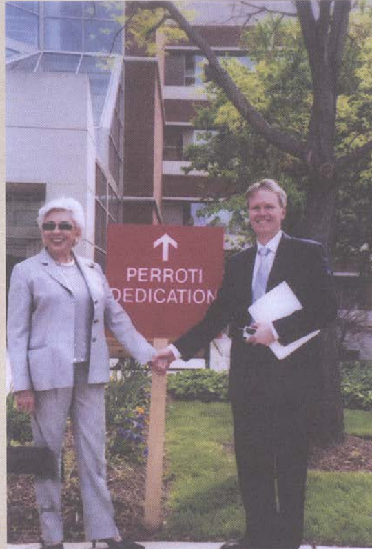
Με τον καθηγητή ιατρικής, David Hellman, στο Johns Hopkins

του, ενώ έχει αρχίσει να δραστηριοποιείται και στο εξωτερικό με την εταιρεία Αρχιρόδον, που αναλαμβάνει έργα από τον Λίβανο και τη Λιβύη έως τη Σαουδική Αραβία. Αναγνωρίζει τις ικανότητες και την εξυπνάδα του Περρωτή και καθώς τον θεωρεί και ιδιαίτερα τίμιο, συνεταιρίζεται μαζί του. Ως άνθρωπος, βέβαια, είναι πιο συντηρητικός και πιο απόλυτος από τον Μπόμπυ, ενώ επιμένει να μην προσφέρει καμία οικονομική βοήθεια στην Αλίκη ο πατέρας της.