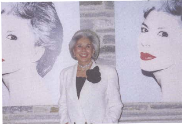
Μπροστά στα πορτρέτα που φιλοτέχνησε ο Warhol

Πάντα δίπλα στην Αμερικανική Γεωργική Σχολή Πέρα από το Κωνσταντοπούλειο, στηρίζει αρκετούς ακόμη σκοπούς και οργανισμούς, ενώ ξεχωρίζει η σταθερή στήριξη που παρέχει στην Αμερικανική Γεωργική Σχολή Θεσσαλονίκης . Η δράση της αυτή ξεκίνησε το 1996 με τη δωρεά σε μνήμη του συζύγου της, Δημήτρη, για να δημιουργηθεί το Κολλέγιο Αγροτικής Ανάπτυξης «Δημήτριος Περρωτής» (Perrotis College) , ως τρίτοβάθμιο τμήμα της Σχολής. «Κάθε χρόνο στέλνω τους δύο πρώτους φοιτητές κατευθειάν στην Αμερική για σπουδές, καλύπτοντάς τους για τρία χρόνια όλα τα έξοδα», λέει με ένα λαμπρό χαμόγελο, αν και είναι πληγωμένη από την αγαριστία που αρ-