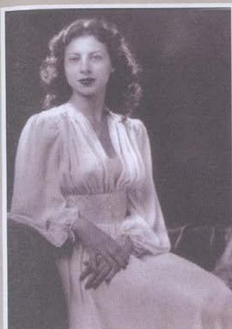
Νεανική φωτογραφία της του μεγάλου φωτογράφου Hugh Cecil, που πήρε το 1ο βραβείο ανάμεσα σε 1.000 φωτογραφίες την εποχή που ζούσε στο Λονδίνο