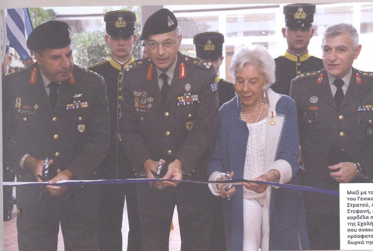
Μαζί με τον αρχηγό του Γενικού Επιτελείου Στρατού, Αλκιβιάδη Στεφανή, κόβουν την κορδέλα στο αμφιθέατρο της Σχολής Ευελπίδων, που ανακαινίστηκε πρόσφατα μετά από δωρεά της